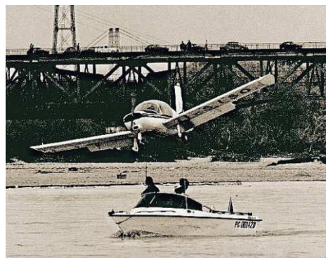
A destra: l'imbarcazione Gobbi 520 naviga nel Po nel 1968; sotto: confronto tra la ripartizione dei mercati internazionali di Absolute.

niato da un piccolo capannone a Carpaneto, studiando il mercato e mettendosi completamente in gioco, con lo scopo di dedicarsi all'innovazione del settore nautico, di affermare il Made in Italy all'estero. Una scommessa certamente non facile, che in poco tempo si è però rivelata vincente, con la continua e costante crescita dell'azienda che ogni giorno costruisce il