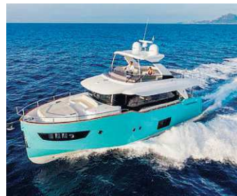
Sopra: L'Absolute 56 FLY naviga al tramonto nella baia di Sydney. A sinistra: L'Absolute Navetta 58 al largo di Hong Kong

ti europei, quali Francia, Spagna e Germania.